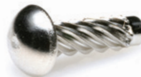
ACIER NICKELÉ NICKEL-PLATED STEEL

Le rivet SIM ou rivet type U est également appelé fausse vis.